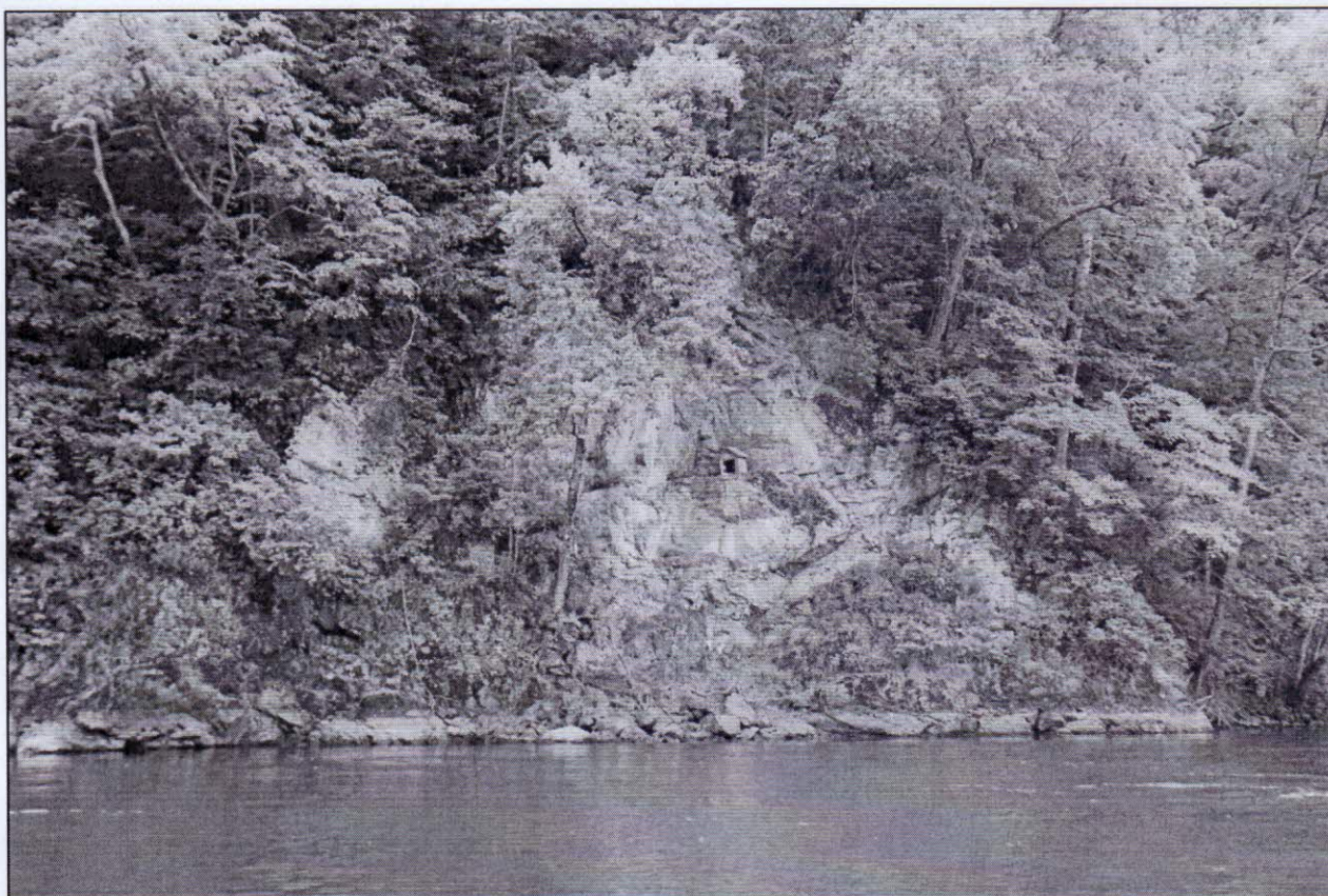
Рисунок 3 – Место ритуального почитания духа-хозяина Онку