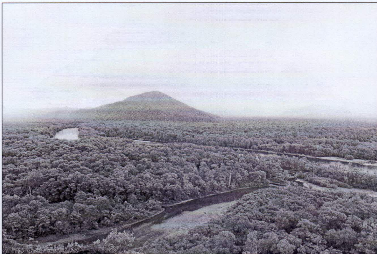
Рисунок 4 – Вид с г. Ульма на пойму реки Бикин