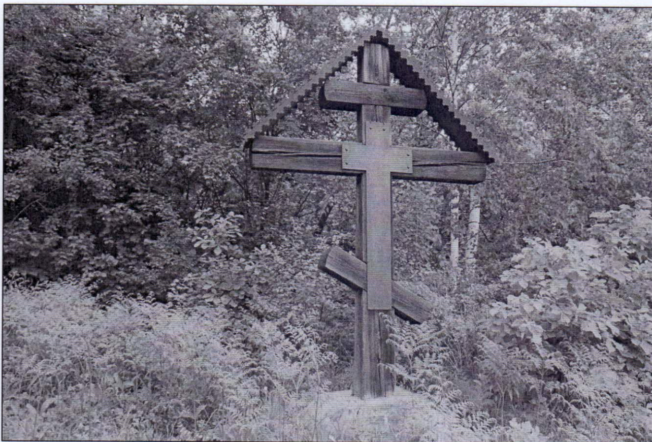
Рисунок 8 – Православный крест, поставленный в память о жертвах сталинских репрессий 30-х годов двадцатого века