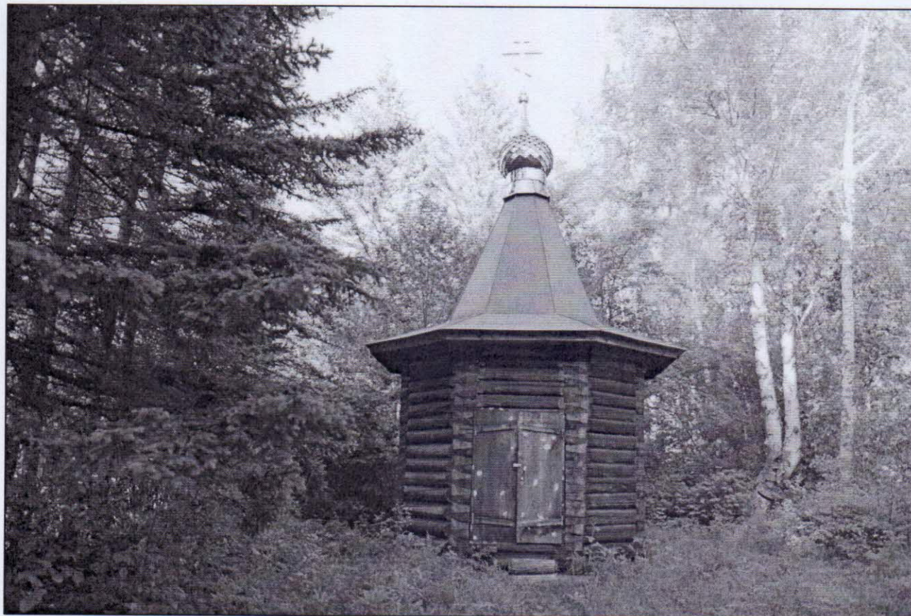
Рисунок 9 – Православная часовня на территории с. Охотничий