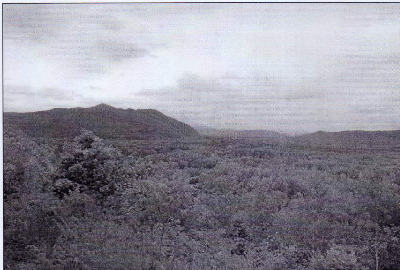
Рисунок 7 – Вид с подножья г. Егоркина (649 м)