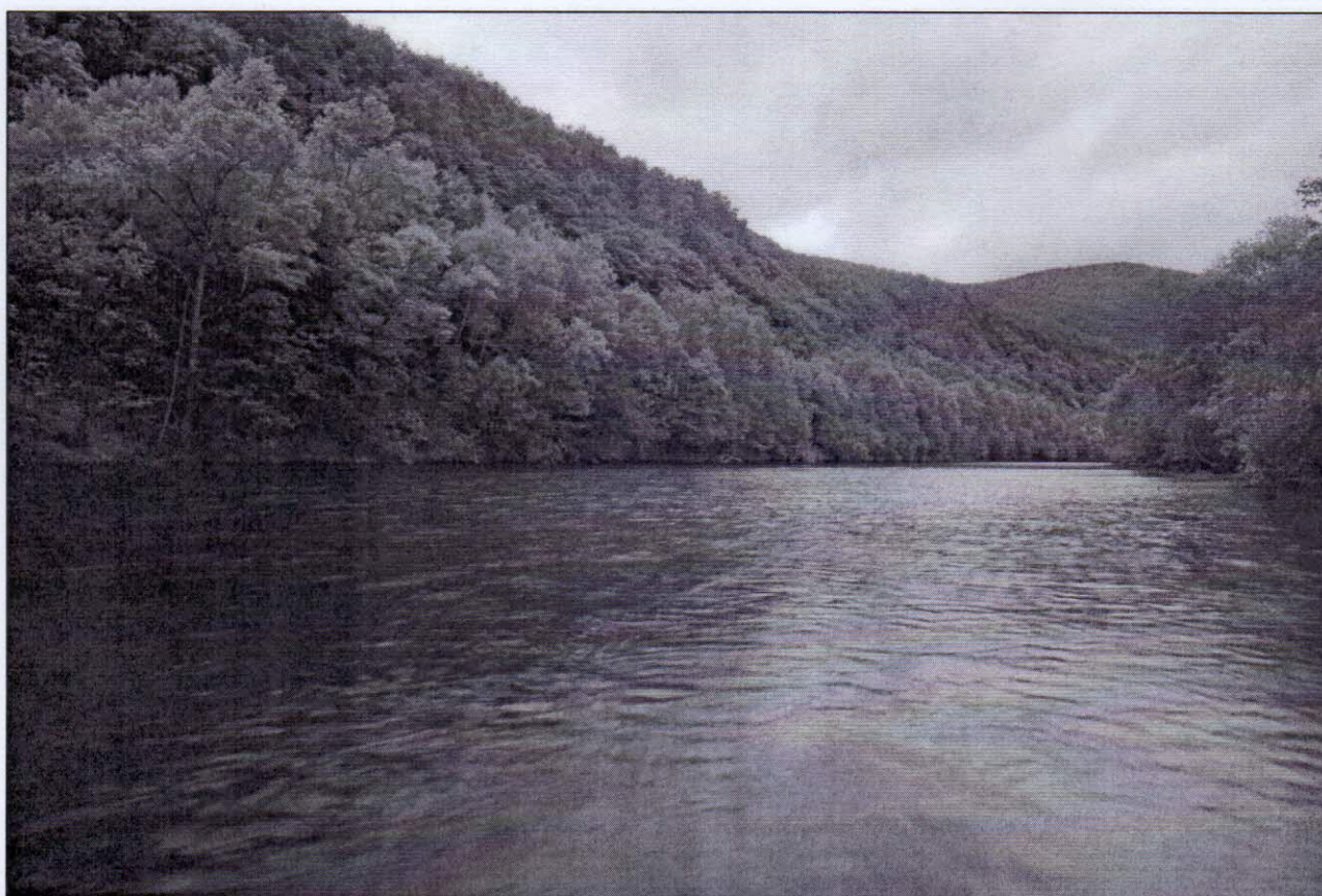
Рисунок 5 – Вид с берега реки Светловодной, с. Охотничий