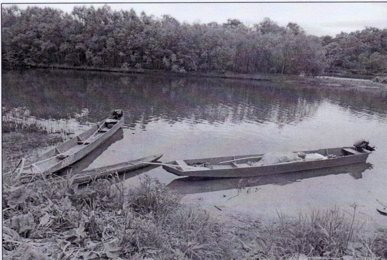
Рисунок 2 – Плавательные средства (ульмаги)