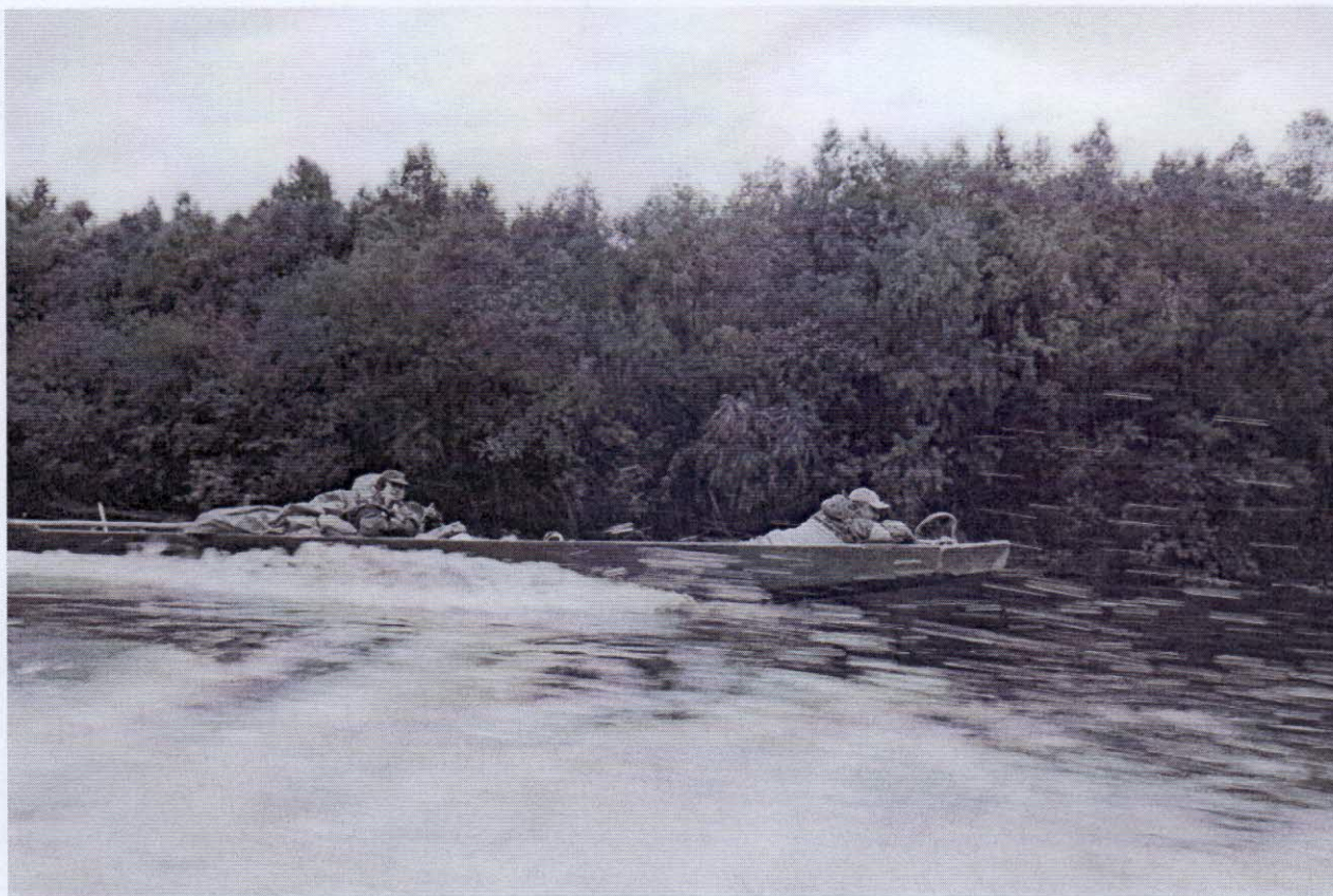
Рисунок 2 – С ветерком на ульмаге