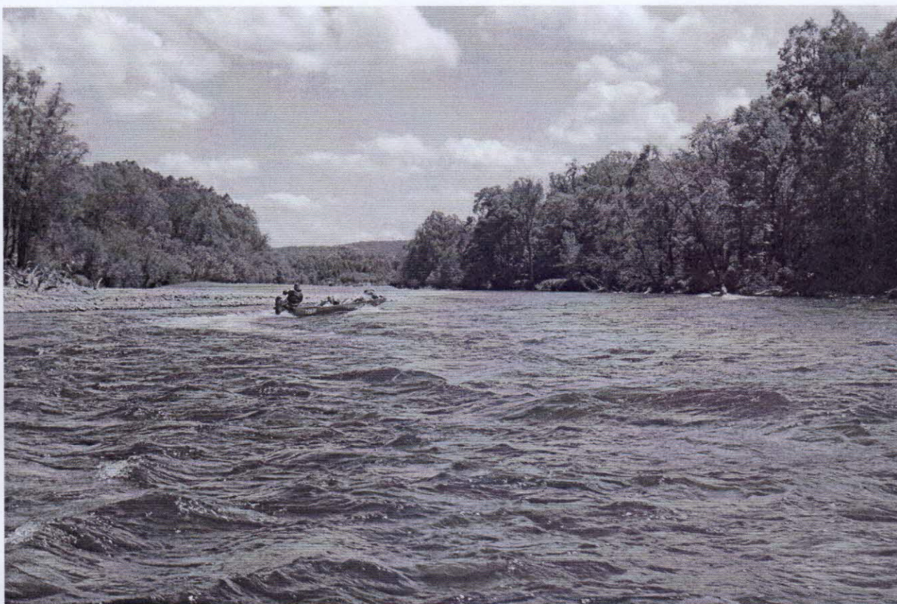
Рисунок 4 – Подъём по реке