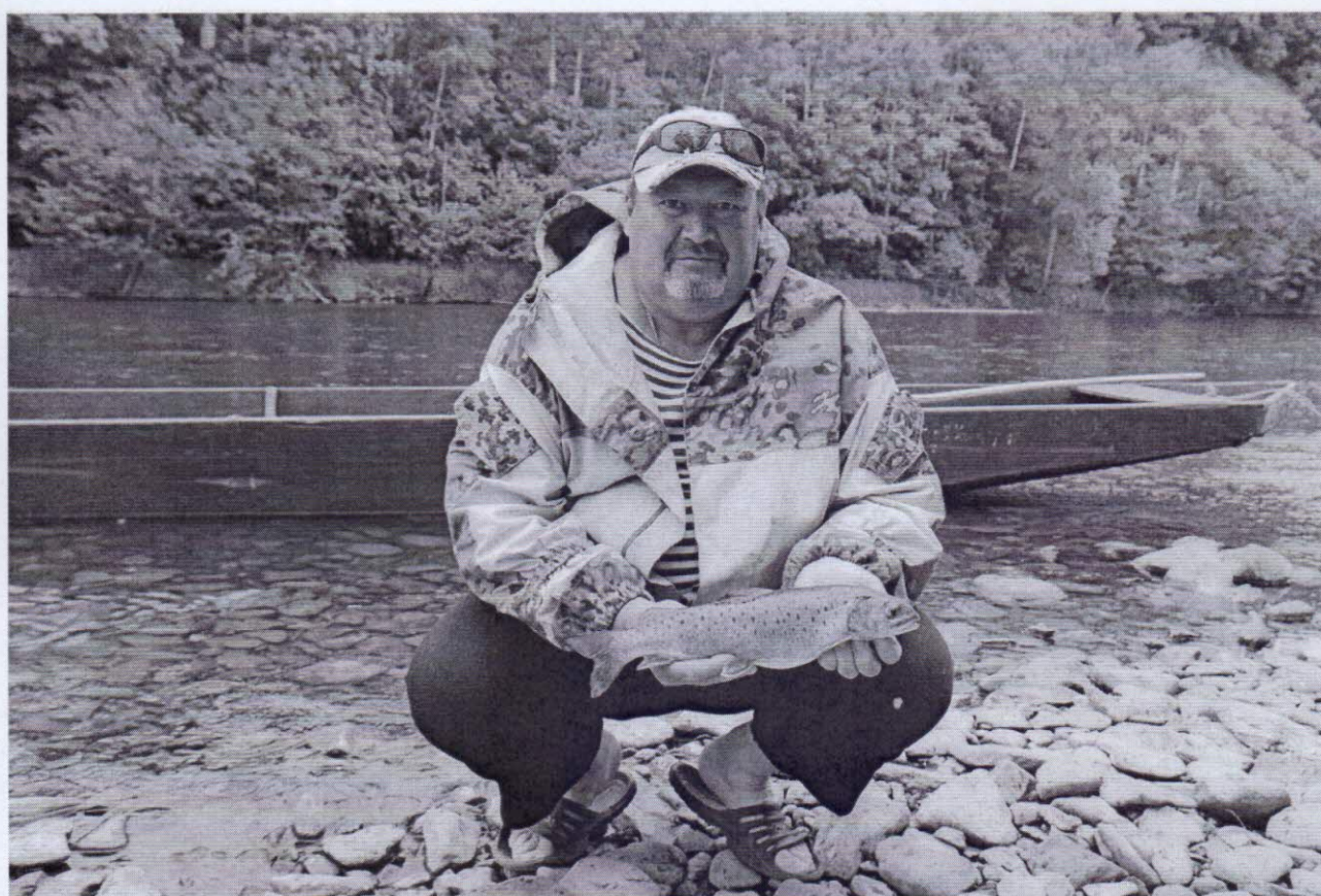
Рисунок 5 – Местный улов