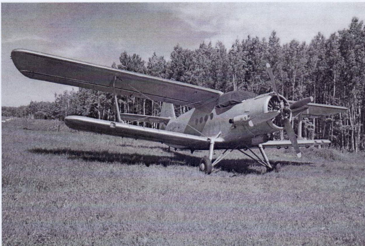
Рисунок 3 – Средство передвижения до с. Охотничий